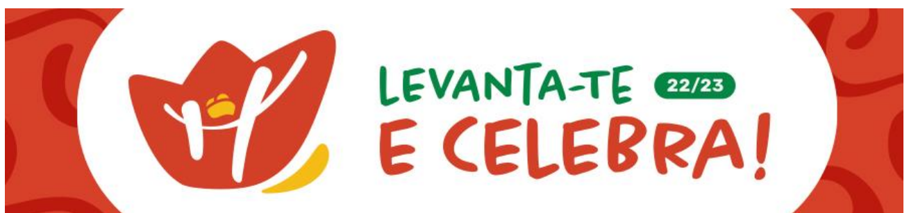
Imagem | A imagem que irá acompanhar a frase deste ano é esta

Quem pensou nesta imagem quis que D. Bosco e Maria Auxiliadora estivessem presentes. Conseguem descobrir?